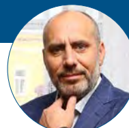
František Jura primátor statutárního města Prostějova

Už v době, kdy situace eskalovala v diplomatické rovině, jsme jako město vyjádřili Ukrajině podporu. Po vypuknutí války jsme navázali kontakt s městem Černivci na jihozápadě Ukrajiny a zorganizovali jsme sbírku materiálu podle jejich požadavků. Ke sbírce jsme přidali další potřebné věci, jako zdravotnický materiál, dalekohledy či termovize, a na ně jsme uvolnili z rozpočtu města 1,5 milionu korun. Chystáme další sbírku různých zařízení pro civilní ochranu města Černivci. V evakuačním centru na Tererově náměstí jsme připravili zázemí pro přechodné ubytování stovky lidí a další asi tři desítky míst jsme vytvořili v azylovém domě pro ženy a matky s dětmi. Oběma těmito zařízeními už prošly desítky žen s dětmi. Jsme připraveni pomáhat dál, události nasvědčují tomu, že ta hrozná situace hned tak neskončí.