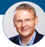
Petr Měřínský primátor města Přerova

Do této chvíle se ruská agrese na Ukrajinu do chodu města příliš nepomítla. Ukrajinské rodiny, jež k nám zatím přišly, zde většinou mají vlastní zázemí. S našimi partnery nabízejícími ubytování se ale připravuje na příchod lidí, kteří budou potřebovat větší pomoc. Už dopředu se snažíme nastavit nějaké procesy, abychom mohli pomáhat rychle a efektivně. Také se na nás obrátilo naše ukrajinské partnerské město Dubno s prosbou o konkrétní materiální pomoc. Vyhlásili jsme proto sbírku zdravotnického materiálu a dalších potřeb, k tomuto účelu jsme také zřídili transparentní účet.