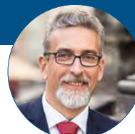
Miroslav Žbánek primátor města Olomouc

Ve Šternberku koordinujeme pomoc lidem z Ukrajiny po dohodě s krizovým štábem Olomouckého kraje. Veškeré nabídky ubytování, hmotné pomoci směřujeme do centrální evidence na krizový štáb. Město připravilo a s pomocí darů spoluobčanů, Charity apod. vybavilo zatím 4 byty pro uprchlíky z Ukrajiny. Byty obsazujeme po dohodě s krizovým štábem. Od úterka 8. března jsou již 2 byty obsazeny a nyní očekáváme další ukrajinské rodiny. Jde o rodiny, které měly cíleně zájem o pobyt ve Šternberku. Ve městě působí také další organizace např. Charita, která organizuje materiální pomoc, Dětský klub Eccáček, z.s., nabízí prostory své herny pro využití maminek s dětmi. Pomoc organizují také občané města, ať již poskytnutím ubytování, nebo finanční či materiální podporou. Děti, které přišly do Šternberka společně s maminkami, se budou postupně začleňovat v našich mateřských a základních školách a volnočasových zařízeních.