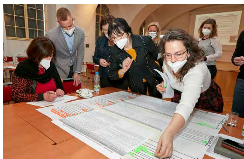
Poslední workshop pro veřejnost se bude konat 7. dubna v budově Krajského úřadu a budou se na něm probírat aktivity, které povedou k naplnění vizi a cílů strategie.

Olomoucký kraj připravuje novou koncepci rozvoje kultury. Do její přípravy zapojil také města, obce a lidi, kteří v oblasti kultury pracují. Zatím poslední dva workshopy proběhly v polovině února ve Vlastivědném muzeu v Olomouci a zúčastnilo se jich téměř osmdesát zájemců. Účastníci nejprve vybrali problémy, které vnímají jako zásadní v oblasti kultury a kulturního dědictví, a poté v menších skupinách rozebrali příčiny těchto potíží a jejich dopady. V závěru každého bloku pak vymysleli náměty pro vizi budoucí strategie. „Těší nás zájem kulturní veřejnosti o zapojení se do tvůrčího procesu. S vysokou účastí jsme se setkávali už na podzim při realizaci workshopů ve vybraných obcích s rozšířenou působností a potvrzuje se i nyní,“ uvedl Jan Žůrek, radní pro kulturu a památkovou péči Olomouckého kraje.